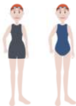
Figura 2. Exemplificação sobre os fatos permitidos para os nadadores cadetes e infantis femininos.