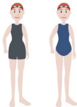
Figura 2. Exemplificaç o sobre os fatos permitidos para os nadadores cadetes e infantis femininos.